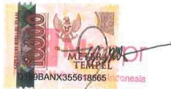
Christianus Endru Direktur Utama

Demikian disampaikan dan pernyataan ini dibuat dengan sebenarnya, atas perhatiannya diucapkan terimakasih.